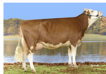
Ćerka Lenita AT 276.900.719

Pigmentacija glave: 19% jednostrano, 8% obostrano